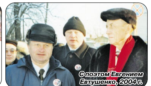
С спозтом Евгением Евтушенко, 2004 г.