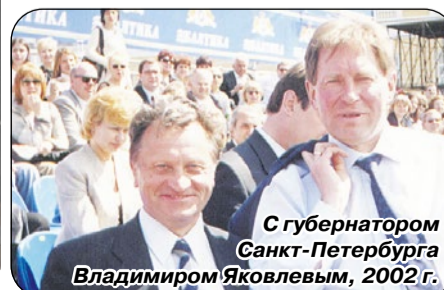
С губернатором Санкт-Петербурга Владимиром Яковлевым, 2002 г.