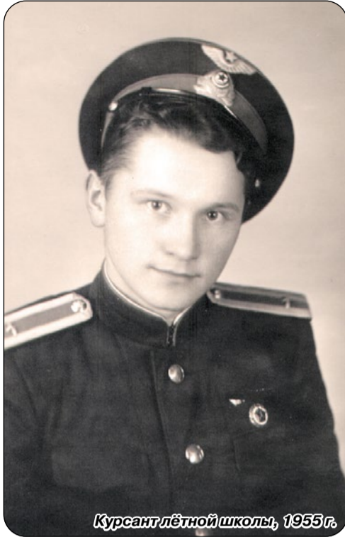
Курсант лётной школы, 1955 г.