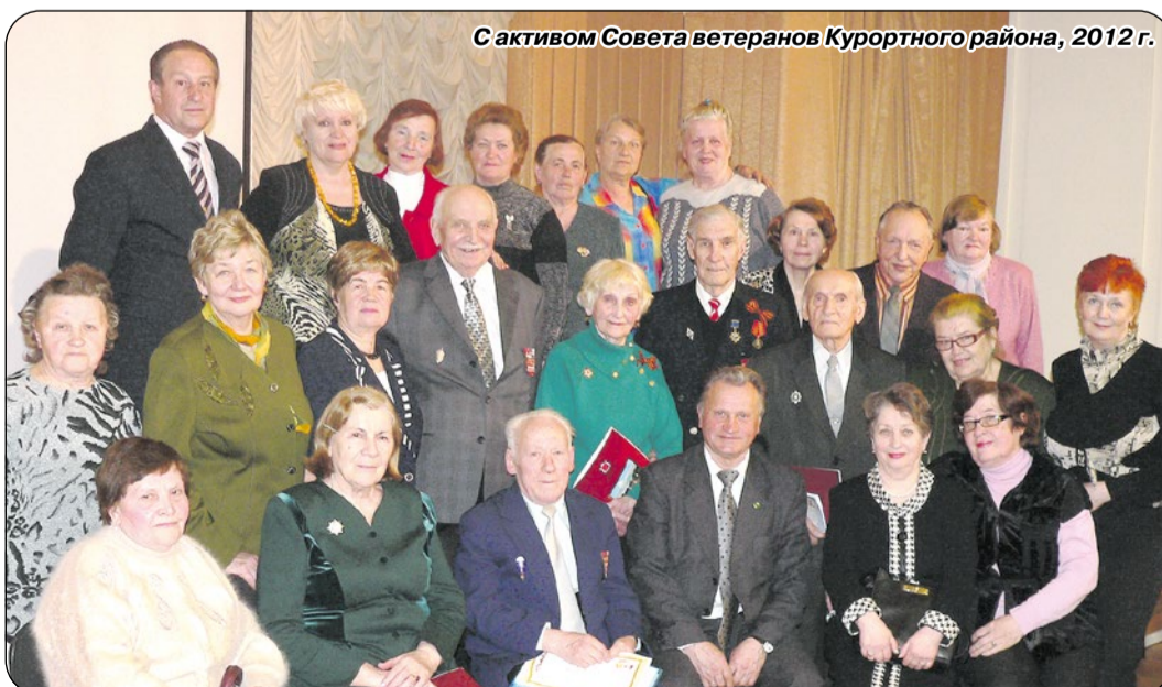
С активом Совета ветеранов Курортного района, 2012 г.

Члены Президиума Совета ветеранов Курортного района