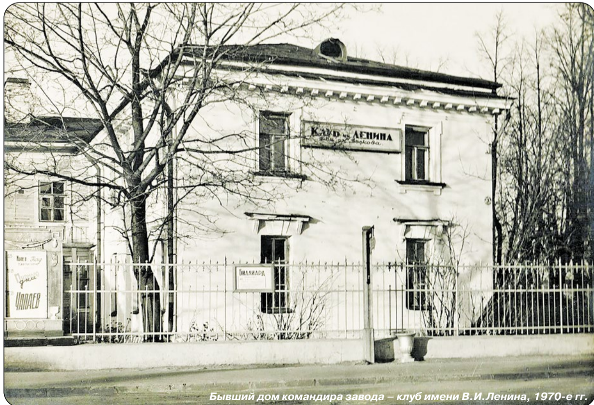
Бывший дом командира завода – клуб имени В.И.Ленина, 1970-е гг.